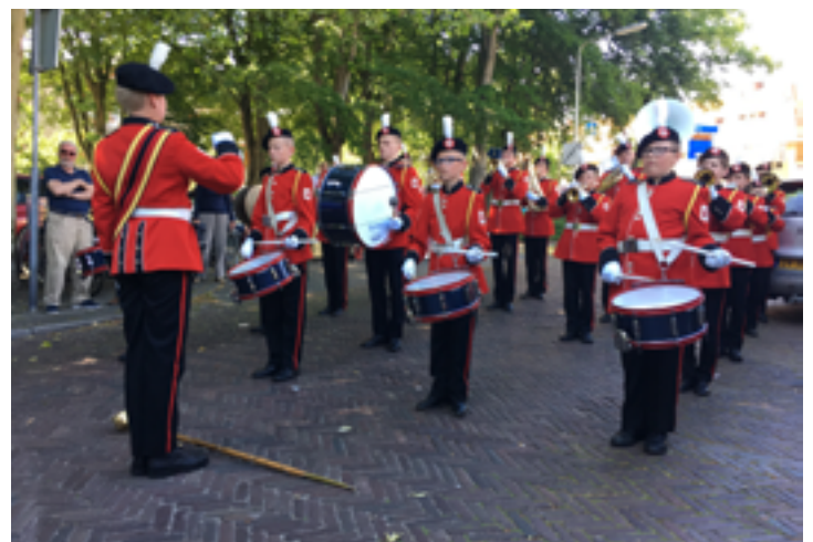
Een heuse fanfare zorgt voor een feestelijke intocht van de lopers. En dan is daar de finish. De tocht is volbracht. Nu is het knuffelen met familie, vrienden en andere belangstellenden.

Een lach, een traan, een woord van dank, een hoera, er is veel te vieren. Met live muziek en een hapje en drankje is het nog een paar uurtjes gezellig.