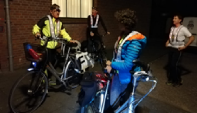
Oei, foute wissel! Ploeg 2 geniet van 2 uurtjes slapen in het gebouw van de Harmonie in Helmond. Ploeg 1 loopt zo snel dat ploeg 2 nog niet klaar staat.