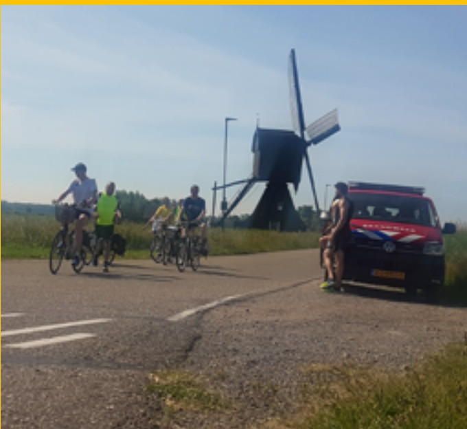
De brandweerbussen brengen de teams van wisselpunt naar wisselpunt. Inmiddels zijn de lopers Zuid Holland ingetrokken.