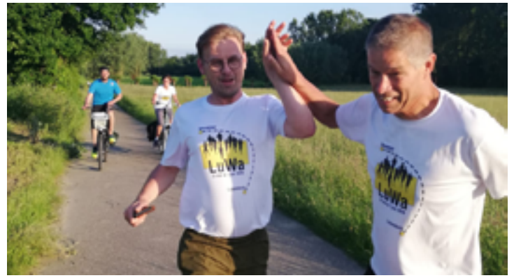
Als een veerpont voor de neus van de lopers wegvaart, loopt de achterstand op het schema op tot 40 minuten. Het tempo van lopen en wisselen wordt daarom stevig opgevoerd.