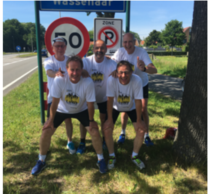
De jonge lopers leggen hun 11 km sprintend af in 37 minuten. De mixploeg volgt een straf tempo en de ervaren lopers zorgen er voor dat de hele ploeg op tijd in Wassenaar is.