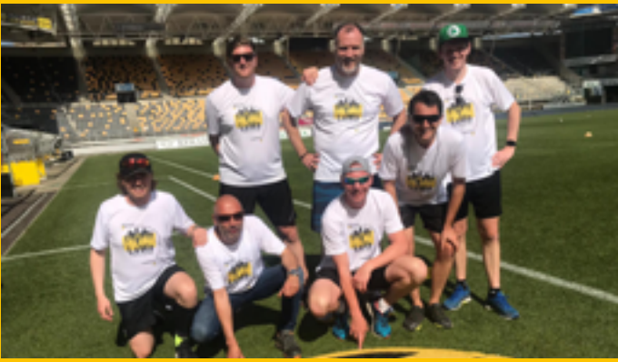
Na het stadion van Volendam in het Rondje IJsselmeer bezoekt de jonge ploeg dit keer het Stadion van Roda JC.